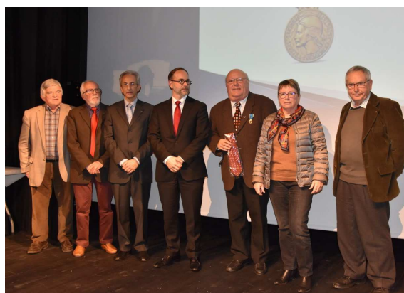
Trophée des associations 2019 Journée Mondiale du Bénévolat Bernay